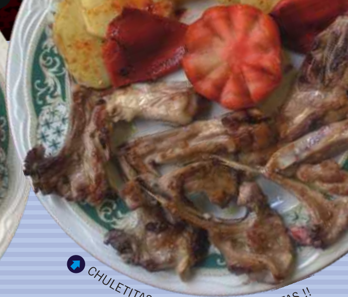
↑ CHULETITAS DE LECHAL !! EXQUISITAS !!