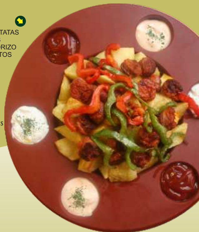
TABLA PATATAS 6 SALSAS CON CHORIZO Y PIMIENTOS