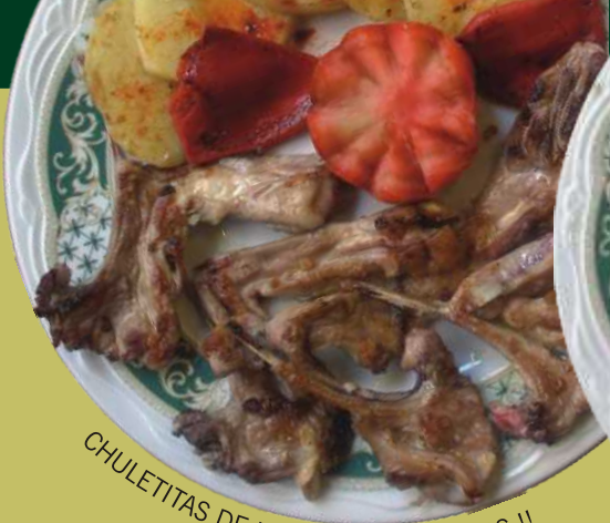
CHULETITAS DE LECHAL !! EXQUISITAS !!