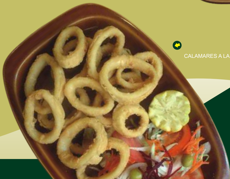
CALAMARES A LA ROMANA