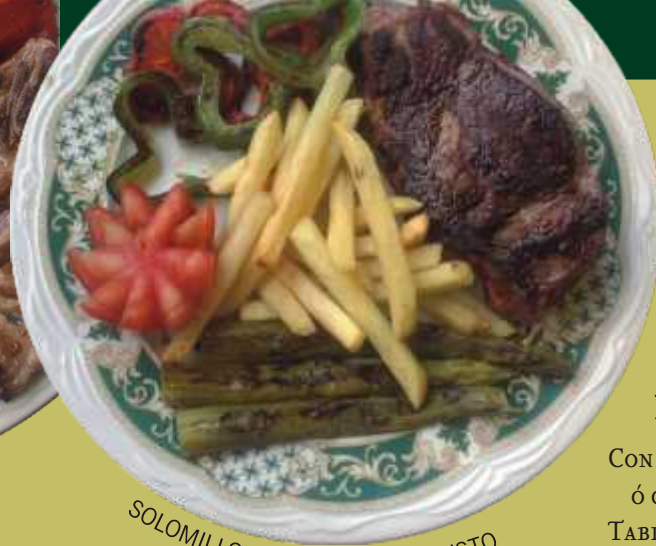
SOLOMILLO O ENTRECOT AL GUSTO